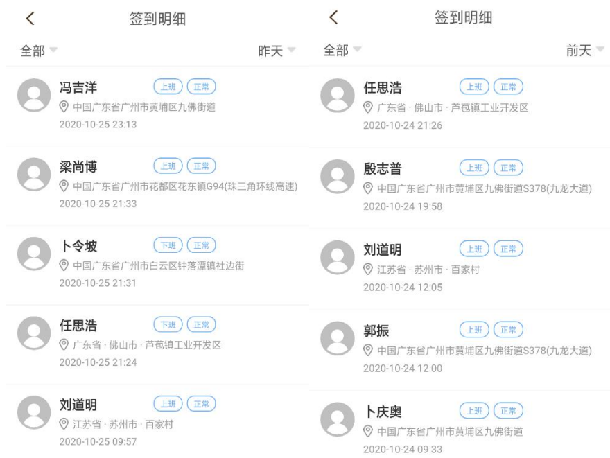
学生每日签到情况

三、周报填写，要求学生对其每周的学习及实习情况进行汇报总结，校企双导师予以批阅打分。